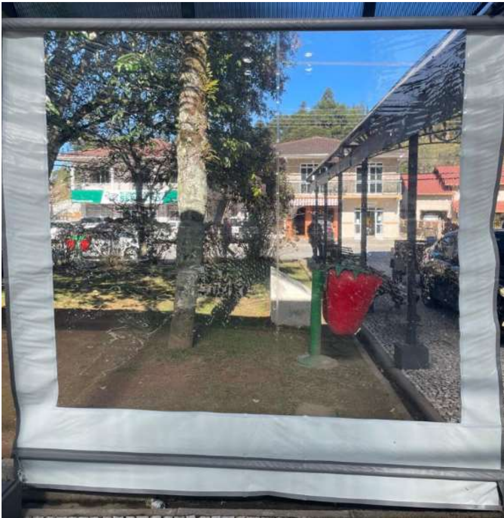
Visão interna do toldo.

Fones: (48) 3275-3100 – CNPJ 82.892.357/0001-96