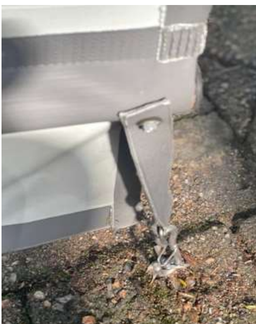
Dispositivo de fixação do toldo ao solo.