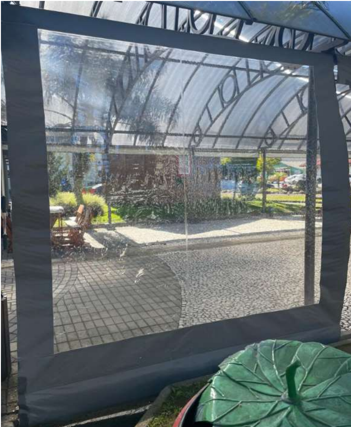
Visão externa do toldo.

Fones: (48) 3275-3100 – CNPJ 82.892.357/0001-96