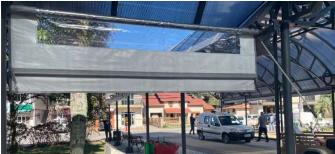
Toldo sendo abaixado pelo sistema de manivela.

Fones: (48) 3275-3100 – CNPJ 82.892.357/0001-96