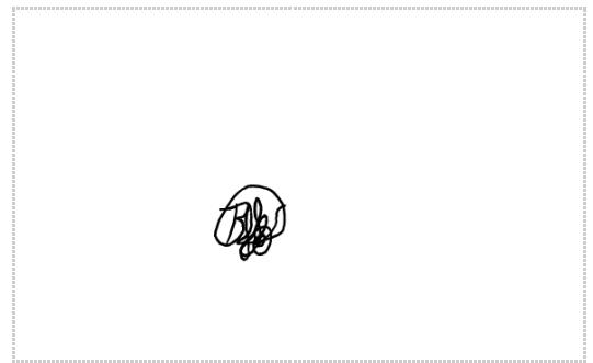
Assinatura de Rofer Arquitetura LTDA

Token: fb874b66-****-****-****-ca3f75014a66