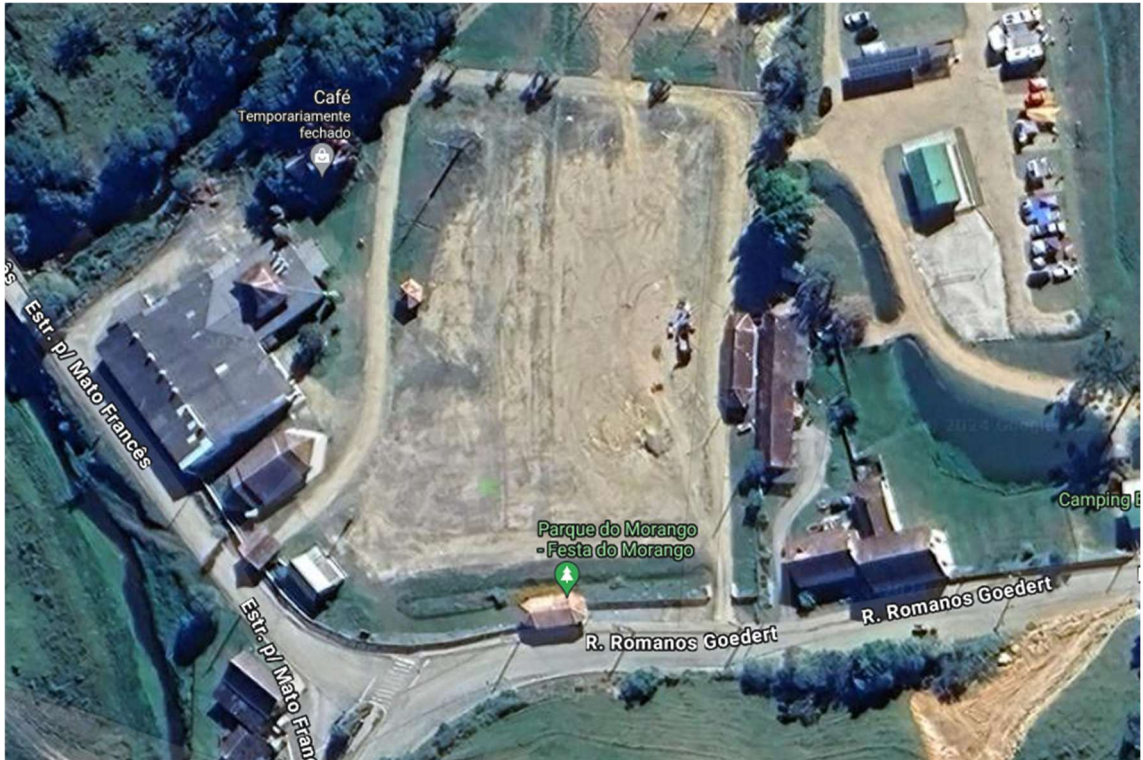
Figura 1 - Visão da área de estudo

ESTADO DE SANTA CATARINA Prefeitura Municipal de Rancho Queimado Praça Leonardo Sell, 40 – Fone: (48) 3275-3100 - CEP 88470-000 Centro – Rancho Queimado – Santa Catarina CNPJ 82.892.357/0001-96